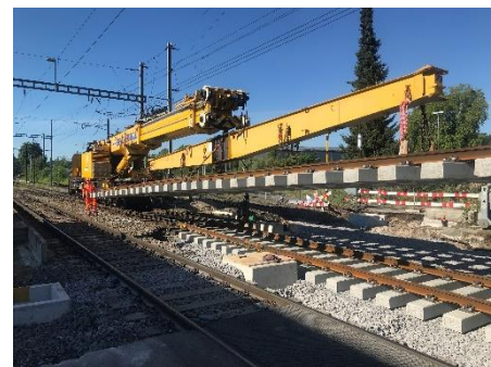
Gleisersatz Bahnübergang Gerlafingen

Der BLS Kundendienst ist täglich zwischen 7.00 und 19.00 Uhr für Sie da. Sie erreichen uns unter: +41 (0)58 327 31 32 oder über unser Kontaktformular auf bls.ch/kundendienst